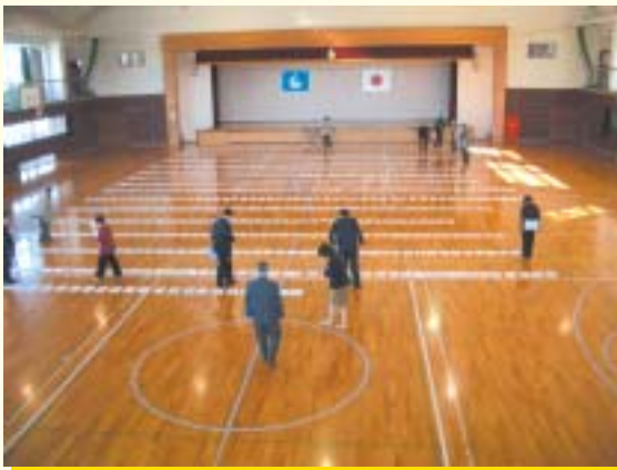
泗水町営体育館に敷詰められた 782点の市章の応募作品